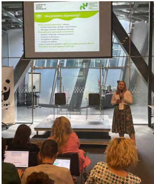
Wystąpienie o działalności Fundacji