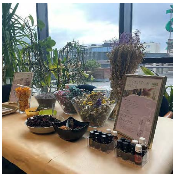
Warsztaty z tworzenia tabliczek florenckich

Warsztaty cieszyły się popularnością wśród pracowników, którzy stworzyli ponad 240 tabliczek.