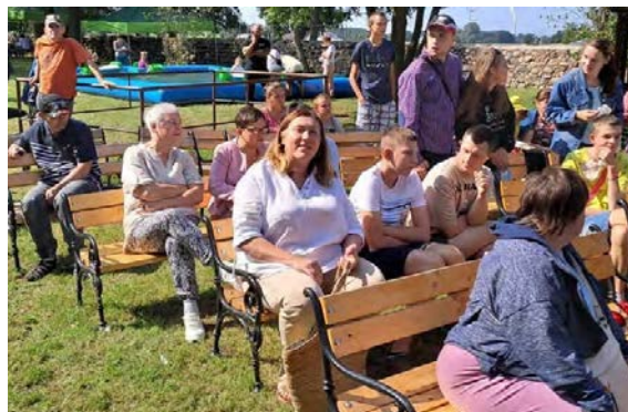
Dzień pieczonego ziemniaka – DPS Goślice

W pierwszej połowie roku powstała nowa strona projektu. Zmiana wpłynęła na zwiększenie czytelności informacji i funkcjonalności systemu obsługi wniosków i sprawozdań.