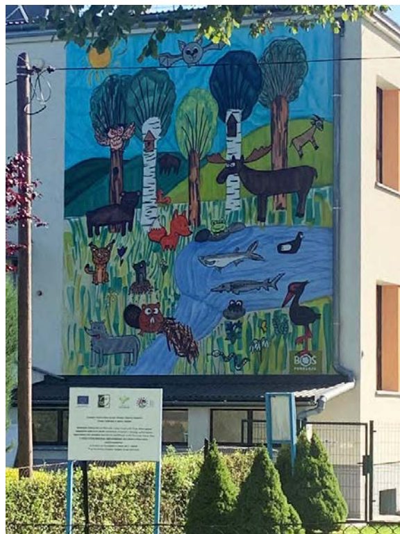
„Zagrożony świat zwierząt”