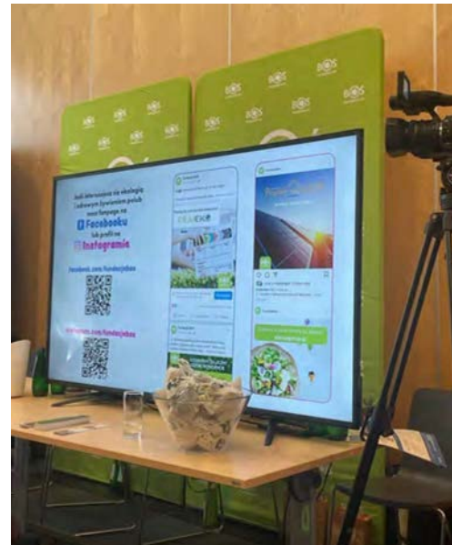
Stoisko promujące projekty Fundacji