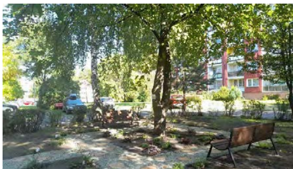
Sąsiedzki zakątek - Sosnowiec

„Zielona Ławeczka” to ogólnopolski, prospołeczny projekt grantowy adresowany do mieszkańców otwartych osiedli zarządzanych przez spółdzielnie, wspólnoty mieszkaniowe lub samorządy w miastach powyżej 10 tysięcy mieszkańców. Projekt umożliwia przemianę zaniedbanych terenów na osiedlach w zielone zakątki w postaci miniogrodów z ławką. Pozwala ożywić miejsca wokół bloków, stworzyć przestrzeń do odpoczynku i spotkań, a także pokazuje mieszkańcom, jak ważne jest wspólne działanie i jakie można osiągnąć dzięki temu efekty. Projekt wspiera merytorycznie ekspertka z Katedry Architektury Krajobrazu IIS SGGW w Warszawie.