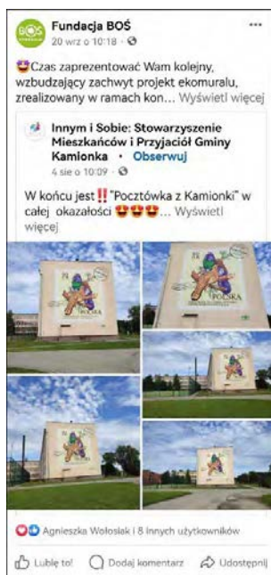
Post z Facebooka

STRONY: FACEBOOK.COM/FUNDACJABOS I INSTAGRAM.COM/FUNDACJABOS