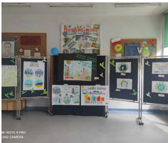
Tablice edukacyjne zespołu „Otuleni Słońcem”

W projekcie młodzież zdobywa wiedzę w zakresie mikroinstalacji OZE i przygotowuje projekty instalacji PV dla domów jednorodzinnych oraz budynków szkolnych, a następnie dzieli się wiedzą ze społecznością lokalną.