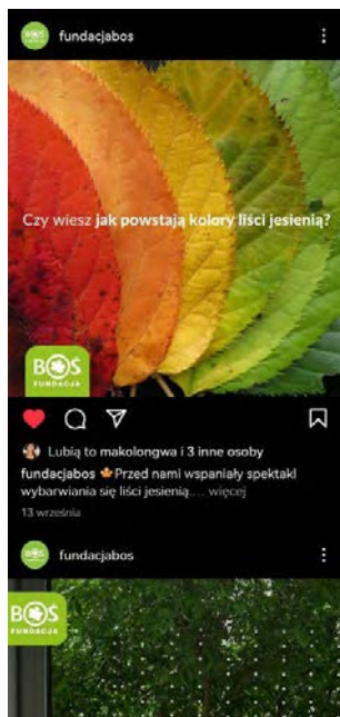
Post z Instagrama

Docelowo Social Media mają być głównym miejscem promocji projektów Fundacji, zastępując inne, droższe formy.