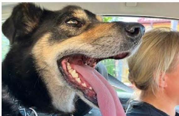
Schronisko w Zamościu – prace nad wybiegiem