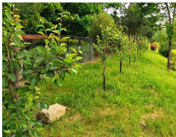
Sad zespołu „Łapanowscy Sadownicy”

Celem „Tradycyjnego Sadu” jest przywracanie i promocja tradycyjnych odmian drzew owocowych, wypartych przez odmiany przemysłowe. Poprzez projekt zwracana jest uwaga uczestników i odbiorców na konieczność zwiększania różnorodności biologicznej, która służy ochronie ekosystemów przyrodniczych. Zadaniem uczestników konkursu grantowego jest stworzenie minisadu, składającego się z co najmniej pięciu drzew, na ogólnodostępnym terenie, np. przy szkole, plebanii lub na działce należącej do gminy.