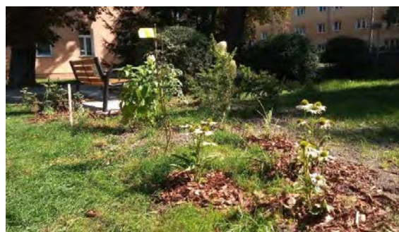
Nowy Świat - Lublin

W marcu 2023 r. została uruchomiona 9. edycja projektu. W tej edycji zespoły mogły otrzymać dofinansowanie w wysokości do 3 000 zł, jeśli przewidziały w swoich projektach elementy mikroretencji lub 2 500 zł bez tych elementów. Zespoły w ramach projektów swoich miniogrodów musiały uwzględnić ławkę.