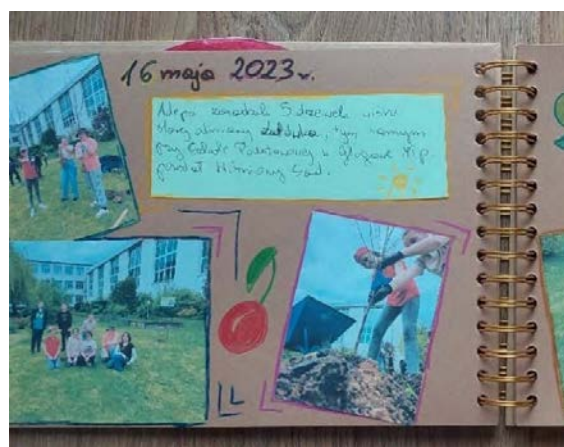
Księga sadu zespołu „Młodzi Adeptci Pomologii”

W grudniu 2022 r. została uruchomiona 6. edycja projektu „Tradycyjny Sad”. Formuła projektu uległa zmianie – nowe szkoły mogły wybrać, czy zakładają sad jabłkowy, gruszkowy, śliwkowy, czereśniowy czy wiśniowy. Z kolei powracające szkoły miały wybór drzew starych odmian, by mogły wzbogacić istniejące już sady.