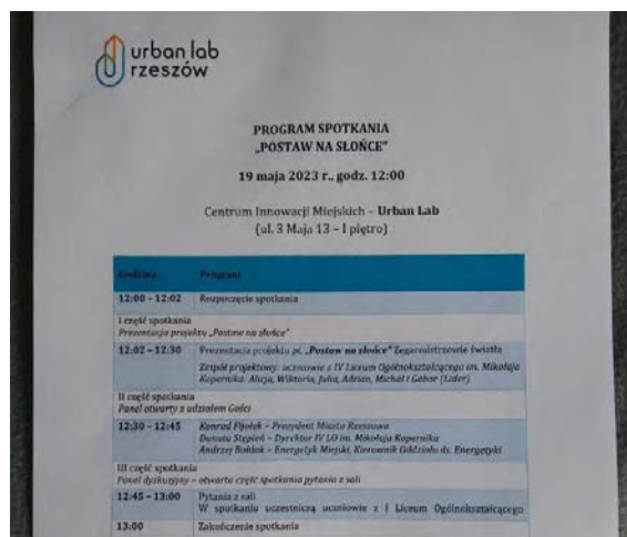
Program spotkania zespołu „Zegarmistrzowie Światła”

9. edycja projektu trwała od października 2022 r. do czerwca 2023 r. Zgłosiły się do niej 242 zespoły uczniowskie (1 317 uczestników). Uczestnicy stworzyli 304 projekty mikroinstalacji.