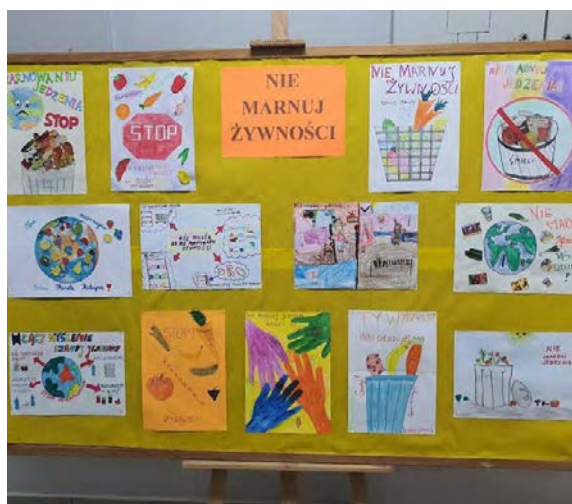
Gazetka ścienna zespołu „Zakliczyńskie Warzywka”

Kolejny ogólnopolski projekt Fundacji BOŚ skierowany jest tradycyjnie do najmłodszych uczniów (zerówki i klasy I-III szkół podstawowych). Fundacja BOŚ realizuje go od 14 lat i od samego początku towarzyszy mu troska o zdrowie młodego pokolenia. Projekt trwa przez cały rok szkolny, podzielony jest na etapy odpowiadające porom roku i ma charakter ogólnopolskiej międzyszkolnej rywalizacji zespołowej. Głównym celem projektu jest wykształcenie u dzieci postaw prozdrowotnych poprzez uczenie zasad zdrowego odżywiania. Począwszy od 7. edycji projekt obejmuje patronatem honorowym Małżonka Prezydenta RP, Pani Agata Kornhauser-Duda.