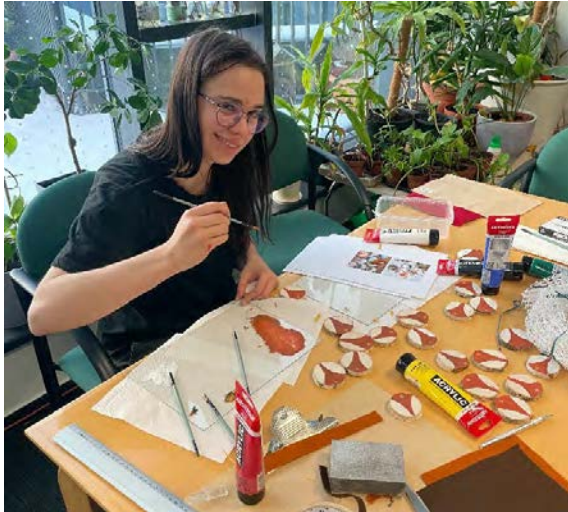
Tworzenie drewnianych zawieszek