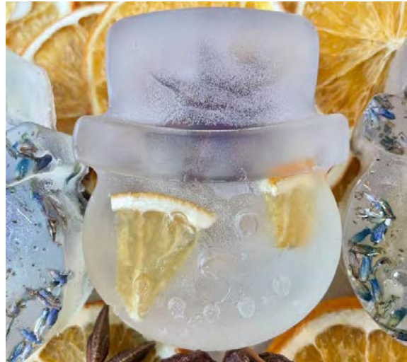
Ręcznie robione mydelka