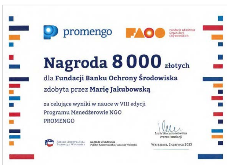
Nagroda dla Fundacji