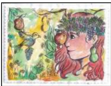
„Uosobienie zdrowia” Rylska Kamil