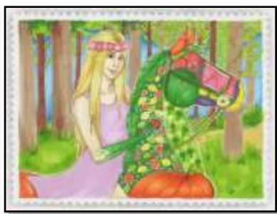
„Kołskie zdrowie” Kruszy Ariadna